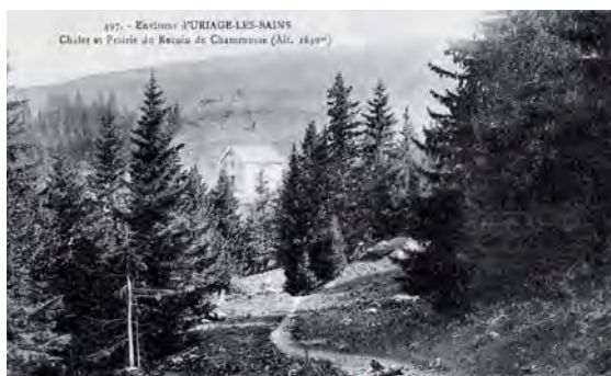
L'ancien chemin reliant Roche-Béranger à Recoin et au fond, le chalet du CAF (vers 1920).