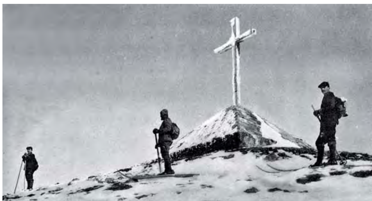
Skieurs à la Croix de Chamrousse au début du siècle. Ceux-ci n'ont, la plupart du temps, qu'un bâton. Ils le tiennent à deux mains et freinent du côté où ils veulent tourner et pour s'arrêter, le mettent entre les jambes et s'assoient dessus.