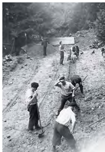
Les séminaristes travaillent aux fondations du chalet durant l'été 1951.