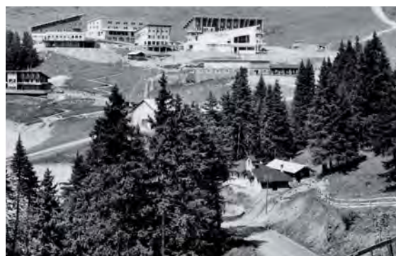
Vue d'ensemble de la chapelle et du chalet. L'ancienne route entre Roche-Béranger et Recoin passe devant la chapelle. La nouvelle, pour les jeux olympiques de 1968, est construite un peu au-dessus du chalet, nécessitant son déplacement. Il est transféré en 1966, près du nouveau centre œcuménique de Roche-Béranger.

La chapelle Notre Dame Sous la Croix reste le témoignage de leur passage dans notre région, même si elle est délaissée depuis la construction en 1968 du centre œcuménique de Roche-Béranger. ■