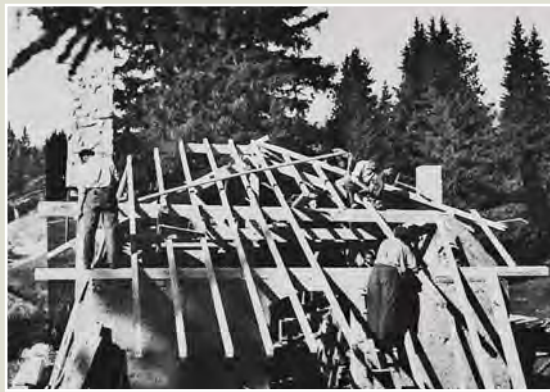
Les séminaristes posent la charpente de la chapelle, au début de l'automne.