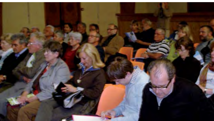
Une centaine de personnes étaient présentes à la réunion d'information

Plus d'une centaine de personnes se pressaient ce jeudi 31 mars, dans la salle polyvalente, pour répondre à l'invitation de la municipalité qui conviait la population à une réunion d'information dont le thème était «quelle eau demain à Vaulnaveys-le-Haut ?» et qui avait pour but d'expliquer la stratégie choisie lors du conseil municipal du 22 février.