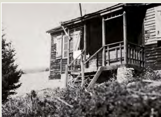
Les séminaristes logent dans un ancien baraquement des chantiers de jeunesse.