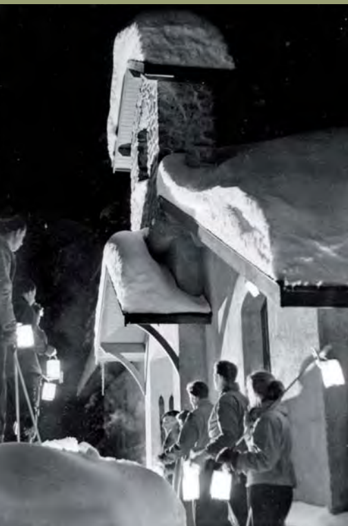
La première fête de Noël est particulièrement réussie. Tous les fidèles arrivent à la messe de minuit avec des torches allumées. Cette tradition s'est perpétuée pendant de nombreuses années.

« la maison de Dieu est le premier édifice (de la future station) à être terminé ». En effet les premiers hôtels et le téléphérique sont encore en chantier.