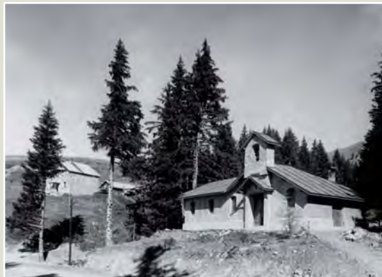
Située sous la croix de Chamrousse, la chapelle est baptisée : Notre-Dame-sous la Croix. C'est le deuxième bâtiment construit à Chamrousse, le premier étant le chalet du CAF, que l'on voit à gauche.