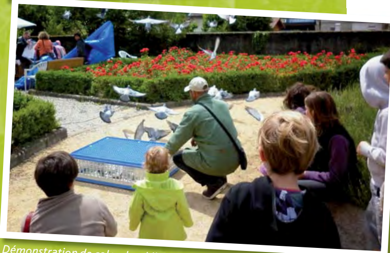
Démonstration de colombophilie