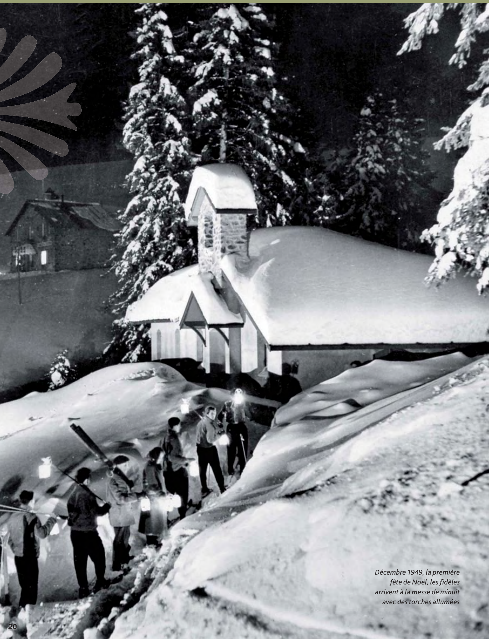
Décembre 1949, la première fête de Noël, les fidèles arrivent à la messe de minuit avec des torches allumées